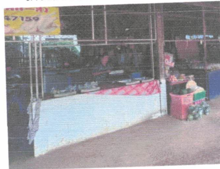
โต๊ะวางสินค้าสูงจากพื้นไม่น้อยกว่า ๖๐ CM.