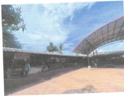
โครงสร้างตลาดแข็งแรงทนทาน