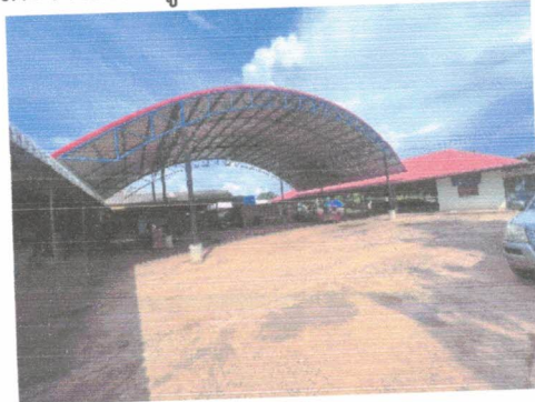
มีที่จอดรถ